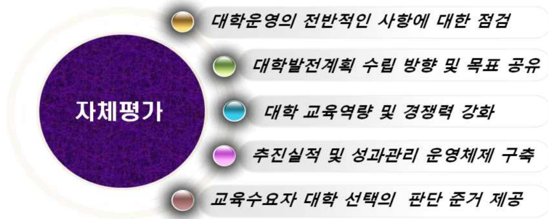
[그림 1] 자체평가의 목적