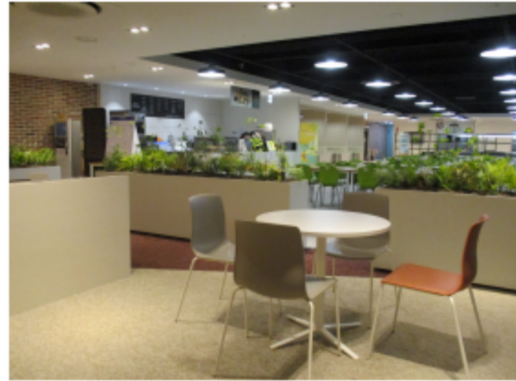
[둔포사업장 카페 & 식당]