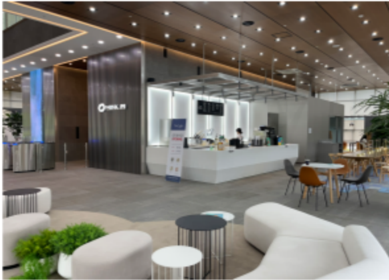
[화성사업장 로비 & 카페]