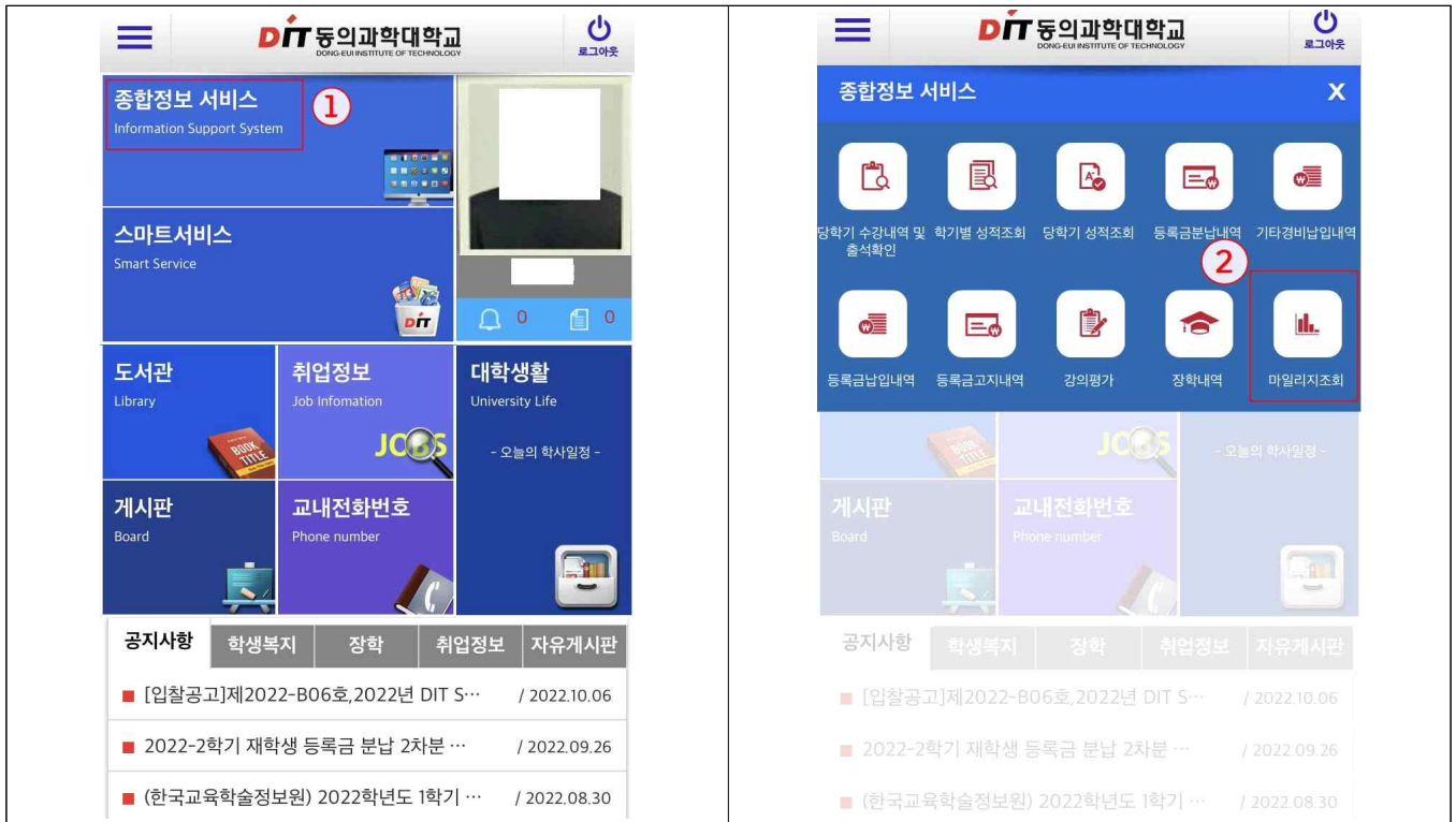
➡ ①종합정보서비스 클릭

✓ 동의과학대학교 스마트앱(핸드폰) → 종합정보서비스 클릭 → 마일리지조회 클릭 → 마일리지 점수 확인 → 상품수령신청 클릭(2024년 취득한 마일리지 점수가 150점 이상일 경우 화면 하단 상품수령신청 버튼 활성화 됨) → 본관 1층 교무부 방문 후 상품권 수령(학생증 지참)